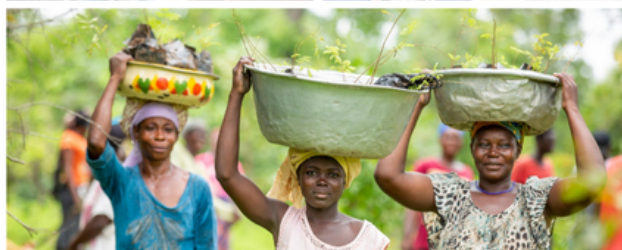
Sunkpa Shea Women's Cooperative