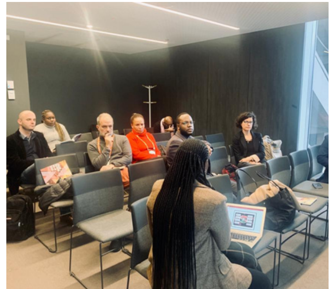
TABLE RONDE SUR LE RAPPORT SUR L'ÉTAT DE L'INDUSTRIE

L'AGK a présenté son tout premier rapport sur l'état de l'industrie à Paris, en marge du salon Food Ingredients Europe 2022.